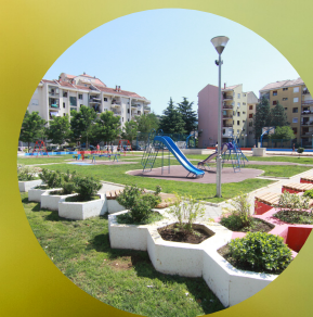
За нова игралишта...