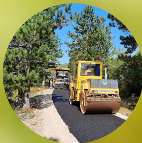
За нове путеве...