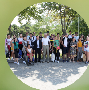
За подршку младима...